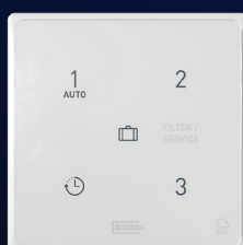
CO 2 -sensor + 3-standenschakelaar