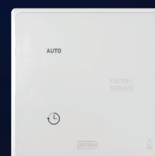
RH-sensor + boost