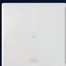
CO 2 -sensor